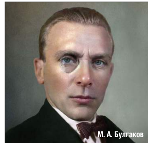
М. А. Булгаков

Если составлять гастрономический рейтинг русских писателей первой половины XX века, то абсолютным лидером станет Михаил Булгаков . «Не читайте до обеда советских газет», «Осетрина второй свежести», «Единственное, что вернет вас к жизни, это две стопки водки с острой и горячей закуской», «Ключница водку делала...»