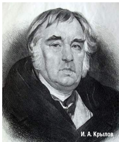
И. А. Крылов

Что за уха! Да как жирна! Как будто янтарем подернулась она. Потешь же, миленький дружок!