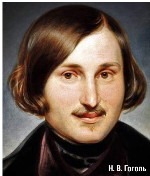
Н. В. Гоголь

Страстные, вдохновенные описания еды выдают в Николае Гоголе либо великого обжору, либо человека, который должен был лишиться себя радости от вкусной пищи и потому так сочно живописал ее на страницах своих книг. Желудок свой он называл «самой благородной частью тела» и в то же время беспрестанно жаловался на плохое пищеварение. Но диет писатель никогда не соблюдал – он горячо любил вкусную еду!