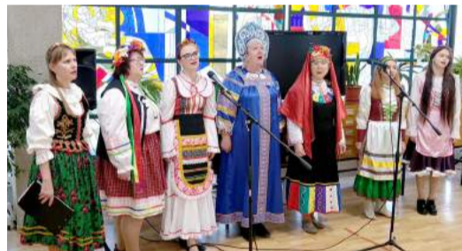
Рисунок на здоровье от волонтеров культуры

Волгоградские волонтеры культуры совместно со студентами-медиками создали арт-объект на фасаде здания детской больницы.